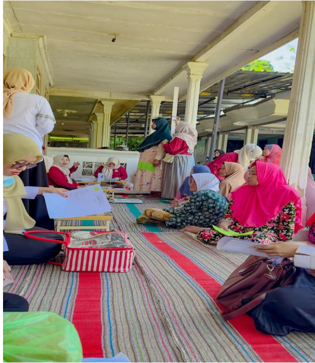
Gambar 1. Pemberian materi P4K oleh narasumber

Pada Gambar menunjukkan pelaksanaan edukasi Program Perencanaan Persalinan dan Pencegahan Komplikasi (P4K) kepada peserta. Materi yang diberikan meliputi perencanaan persalinan, tanda bahaya kehamilan, persiapan donor darah, pemilihan tempat persalinan, dan transportasi rujukan. Edukasi ini bertujuan meningkatkan pengetahuan dan kesiapsiagaan peserta dalam mencegah komplikasi kehamilan dan persalinan.